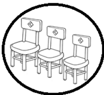
conjunto de sillas