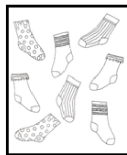
conjunto de medias