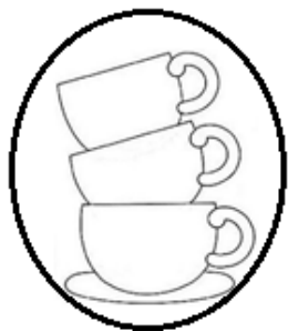
conjunto de tazas

Ayudado de tu dedo índice lee el nombre de estos conjuntos